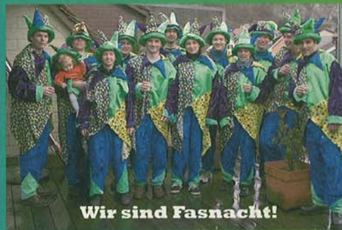
Wir sind Fasnacht!