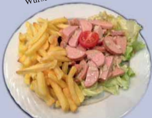
Wurst im Dichtestress!