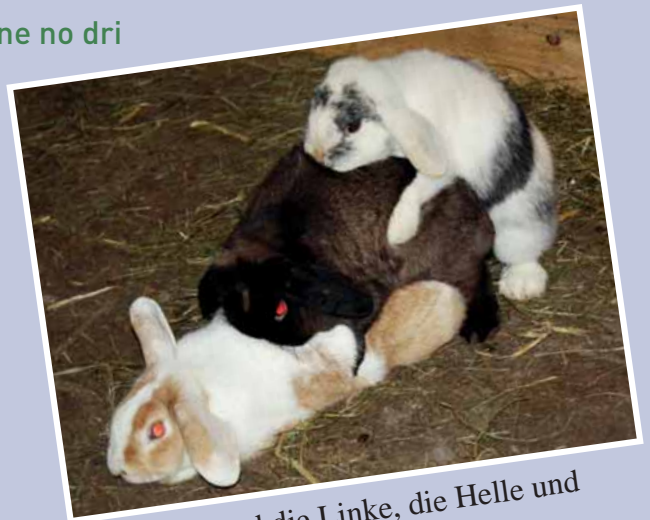
die Rächte und die Linke, die Helle und die Dunkle – aui mache mit!