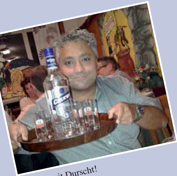
Bike, das git Durscht!